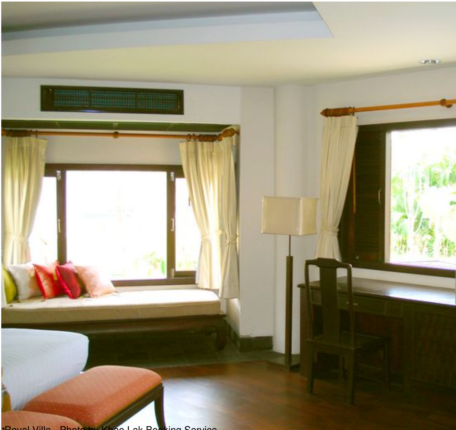
*Royal Villa

Sonntag, den 14. Juni 2009 um 18:26 Uhr - Aktualisiert Dienstag, den 29. September 2009 um 17:04 Uhr